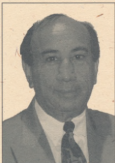
Nā te Toihau o Te Taura Whiri i te Reo Māori

Kua puta te karanga a Te Whakakotahitanga o Ngā Iwi o Te Ao kia kīia te tau e tū mai nei ko Te Tau o te Kaumātua Puta Noa i te Ao, otirā koirā tāku nā whakamāoritanga i tērā whakaaro. Ko tāku e whakapae ana e kōrero kē ana rātou mō te hunga pēperekōu kua i tā te Māori titiro ki tēnei mea, ki te kaumātua