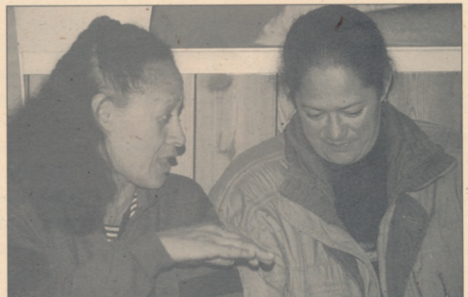
Te hōhonu hoki o te kōrero Tētahi tokorua i te Kura i tū ki Mōkai Marae

Ko ētahi o mātou i tēnei o ngā kura he kaiako i te tari Māori o Te Whare Wānanga o Waikato, ā, i te kore kairiwhi mō tētahi, ka haria mai ana pia i te rā whakamutunga o te hui. Ora katoa ana te ngākau i te mahi a te mātātahi e ngākau nui ana ki tō rātou reo me tō rātou hiahia kia whakamātau rātou i ngā mahi a te kaiwhakamāori i ngā kōti. Kia kaha koutou ngā waka kawē i tō tātou reo ki roto rawa atu o te mano tau hou e whātare mai ana i te pae. Kia kaha anō hoki tō koutou pouako, me kore noa e whāia mai Te Tāunga Tohu i te Matatau e koutou ana pia i roto i ngā tau.